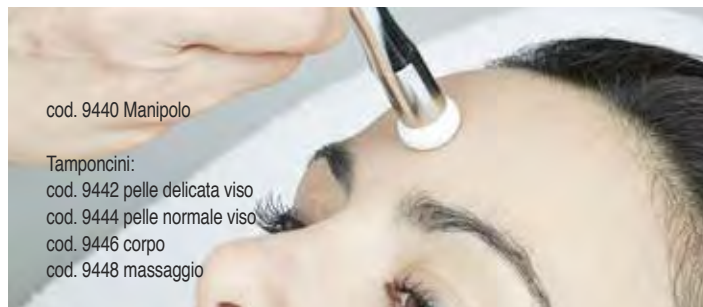
cod. 9440 Manipolo

Permette l'esfoliazione degli strati epidermici, favorendo il ricambio cellulare del tessuto trattato. Migliora la permeabilità della cute, facilitando un maggiore assorbimento dei cosmetici scelti in base all'inetetismo da trattare.