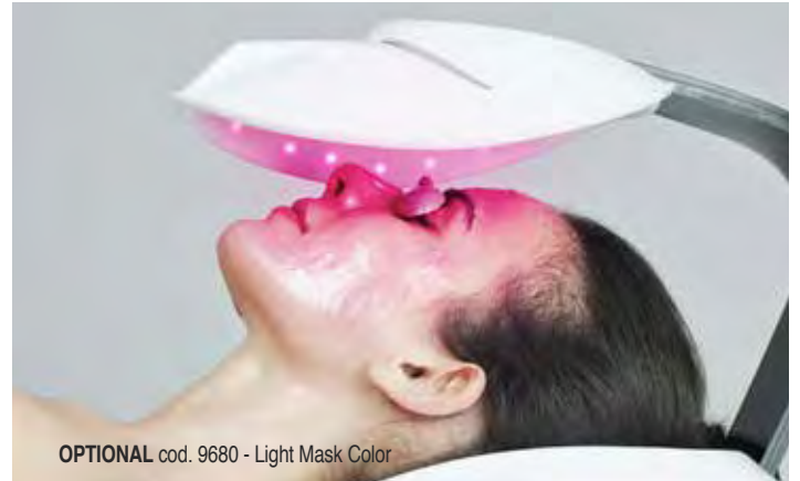
OPTIONAL cod. 9680 - Light Mask Color