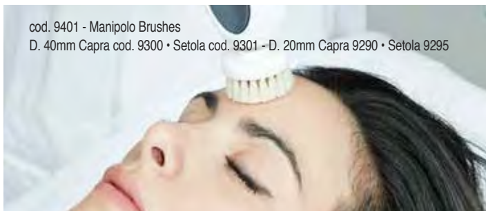
cod. 9401 - Manipolo Brushes D. 40mm Capra cod. 9300 • Setola cod. 9301 - D. 20mm Capra 9290 • Setola 9295

Tra i trattamenti di pulizia, uno dei più importanti è il Brush, un'azione meccanica delicata eseguita attraverso diverse tipologie di spazzole.