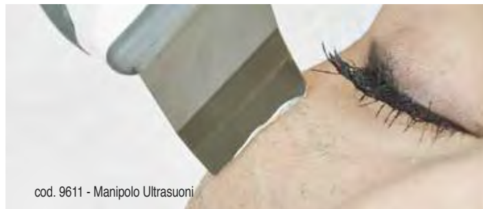
cod. 9611 - Manipolo Ultrasuoni

Azione di pulizia profonda e penetrazione dei principi attivi. Unisce l'effetto degli ultrasuoni alla vibrazione esercitata dalla spatola per effettuare un peeling meccanico e trattamenti viso. Le diverse frequenze utilizzate permettono di svolgere un'azione rigenerante, tonificante, elasticizzante con ottimi risultati su tutti i tipi pelle con 14 programmi specifici.