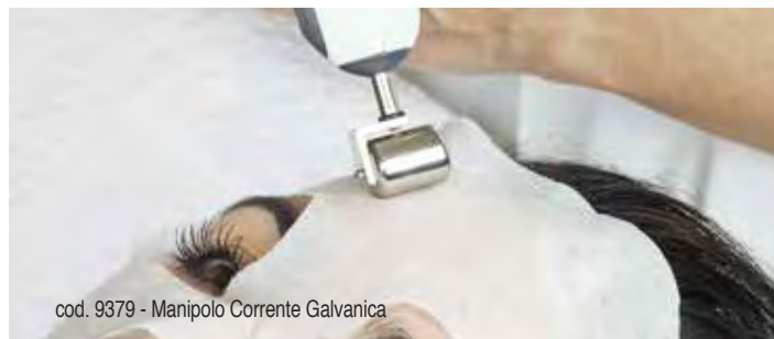
cod. 9379 - Manipolo Corrente Galvanica

È utilizzata per ottenere sia un'azione di disincrostazione cutanea sia un'azione di ionoforesi per la penetrazione dei sieri specifici. 2 programmi: Disincrostante, Ionoforesi.