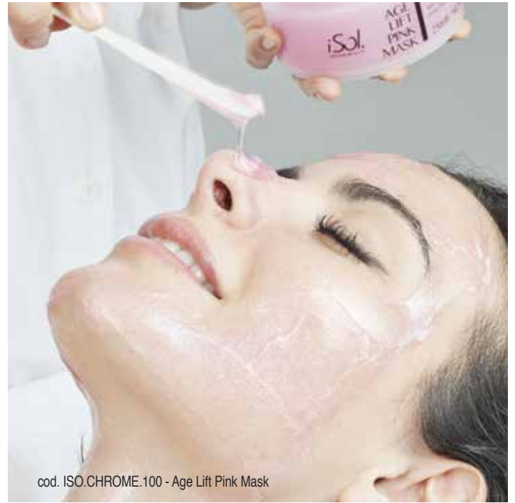
cod. ISO.CHROME.100 - Age Lift Pink Mask

Trattamento cromo benessere che utilizza diversi colori personalizzabili in base alle preferenze individuali, ottenendo così un maggior relax e beneficio nella fase finale del trattamento. Associato alle maschere specifiche iSol Chrome permette di intensificarne il risultato donando al volto un illuminante effetto finale.