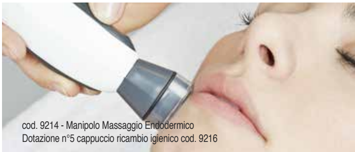
cod. 9214 - Manipolo Massaggio Endodermico Dotazione n°5 cappuccio ricambio igienico cod. 9216

E' piacevole ed efficace come un massaggio manuale, ma consente un trattamento più uniforme sul viso e meno faticoso per l'estetista. Adotta un nuovo principio brevettato di Vacuum-Massaggio che utilizza una delicata azione di aspirazione e rilascio per evitare danni al derma e alla rete capillare.