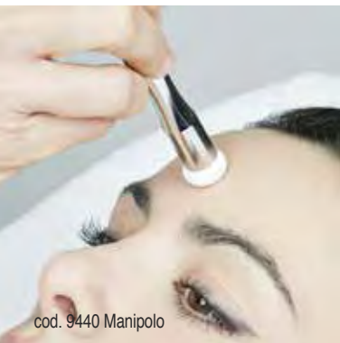
cod. 9440 Manipolo