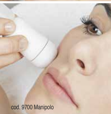
cod. 9700 Manipolo

Prima di procedere al trattamento di Radio Frequenza, stendere col pennello l'emulsione R.F. & Stim Face Emulsion per permettere la massima conducibilità dell'energia, agevolare lo scorrimento del manipolo e favorire la tonificazione. Impostare la potenza della Radio Frequenza, posizionare il manipolo a contatto con la parte da trattare e successivamente premere start. Lavorare con movimenti rotatori per circa 20 minuti.