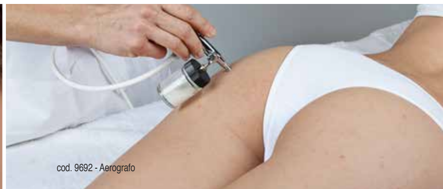
cod. 9692 - Aerografo