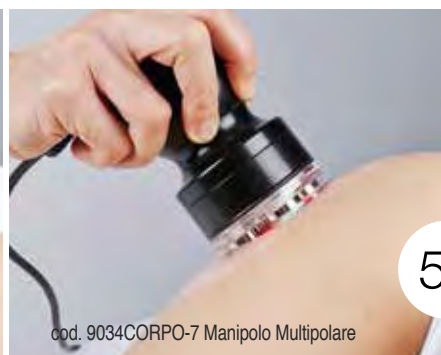
cod. 9034CORPO-7 Manipolo Multipolare