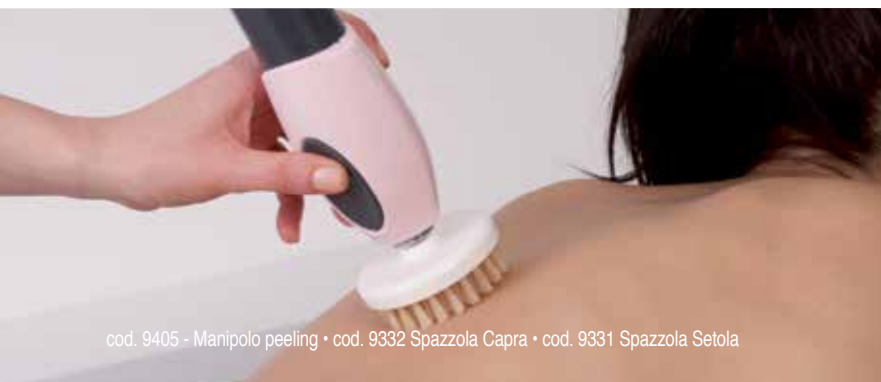
cod. 9405 - Manipolo peeling • cod. 9332 Spazzola Capra • cod. 9331 Spazzola Setola