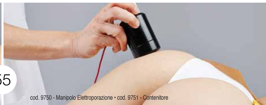
cod. 9750 - Manipolo Elettroporazione • cod. 9751 - Contenitore