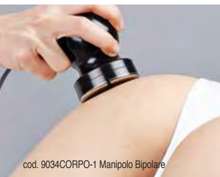
cod. 9034CORPO-1 Manipolo Bipolare

*per gli inestetismi causati dalla cellulite