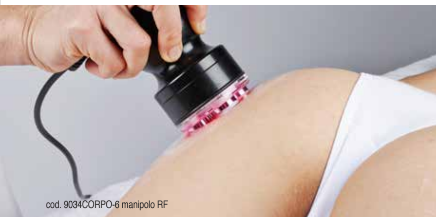
cod. 9034CORPO-6 manipolo RF