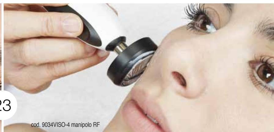
cod. 9034VISO-4 manipolo RF

Questo trattamento dallo straordinario effetto liftante, contrasta il rilassamento cutaneo. Innalzando la temperatura del tessuto connettivo esistente e attivando, attraverso il calore, i fibroblasti a produrre nuovo Collagene e nuova Elastina, permette di attenuare le rughe e i segni dell'invecchiamento, ringiovanendo il viso, per un effetto di compattamento e distensione dei tessuti del tutto naturale. Significativi risultati, visibili dopo qualche mese.